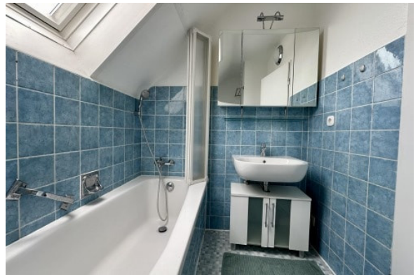
DG - Bad