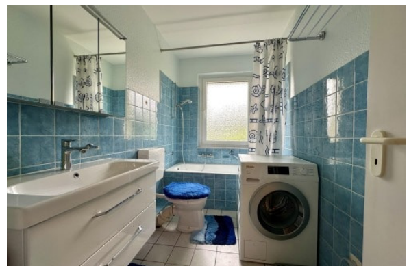
EG - Bad