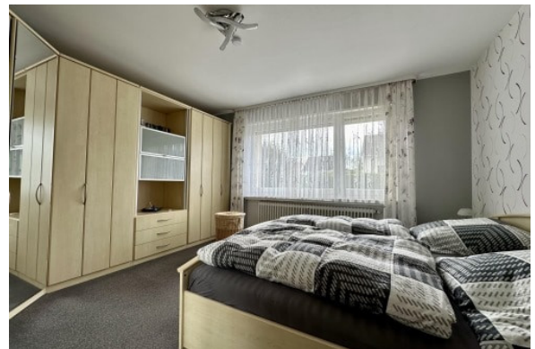
EG - Schlafen