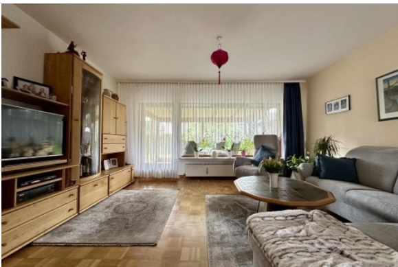
EG - Wohnen