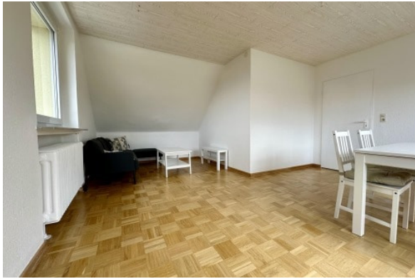
DG - Wohnen