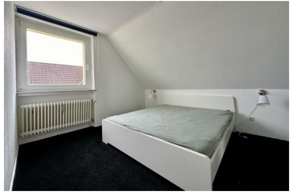
DG - Schlafen