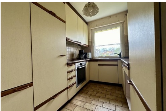
EG - Küche