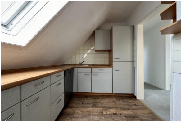
DG - Küche